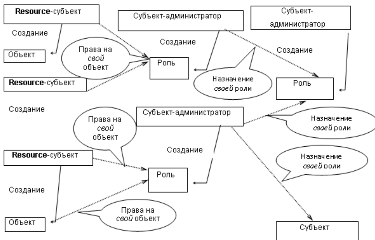
Рисунок 2. Схема построения ролей в СУБД ЛИНТЕР